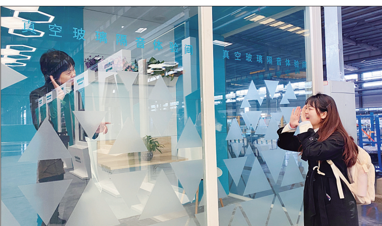
市民体验获得专利的隔音玻璃技术

年10月至2021年9月,该中心共受理涉嫌商标、专利等侵权假冒情175条,且全部办结。