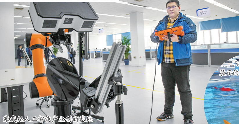
寒武纪人工智能产业创新基地

传统教育有机结合,构建基于教育大数据的教育云平台,形成学校、教师、学生等权威数据源,逐步实现大规模因材施教和个性化学习。