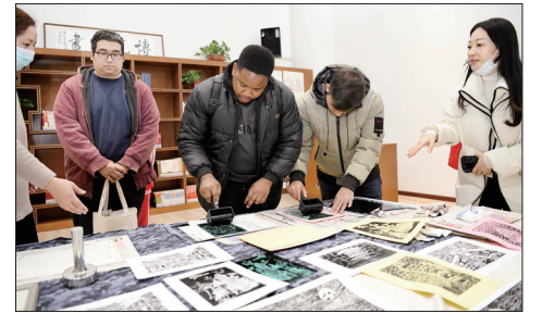
外国青年体验拓印

本报讯(记者 李冰 通讯员 韩露)近日,由市政府新闻办、市委外事办主办的“外国青年看洛阳”活动举行,旨在让优秀外国青年感知洛阳发展的速度、温度,增强青年群体对洛阳的城市认同,让外国青年认识洛阳、爱上洛阳,助力青年友好型城市建设。