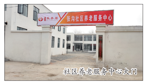
社区养老服务中心大门