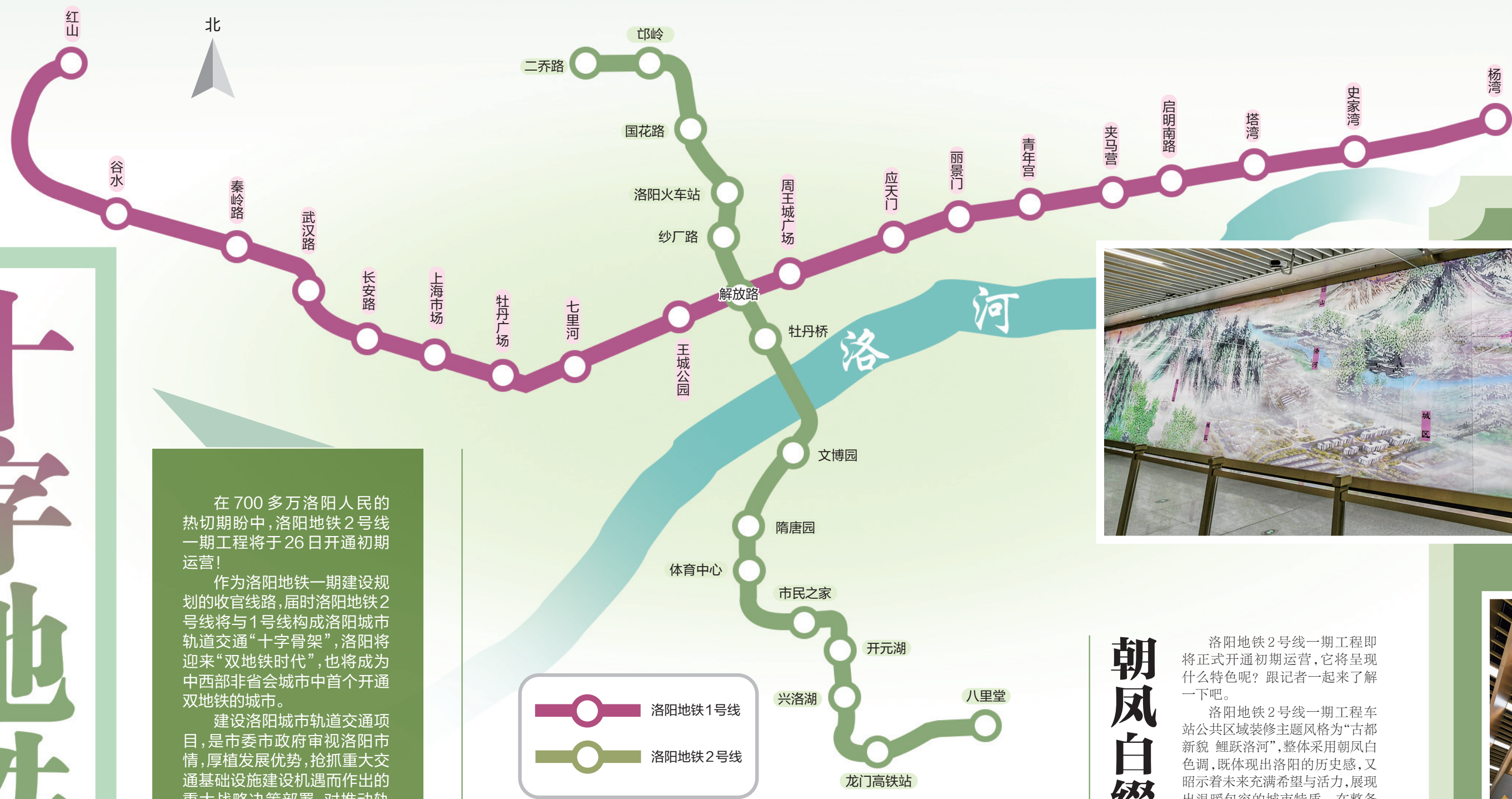
洛阳地铁1号线 洛阳地铁2号线

在700多万洛阳人民的热切期盼中,洛阳地铁2号线一期工程将于26日开通初期运营!