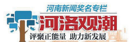
评鉴正能量 助力新发展

实证明,有融入新技术新表达新模式的创意加持,历史文化才能活起来、火起来,“文旅+”才能加出无限可能。抓住颠覆性创意、沉浸式体验、年轻化消费这三个关键,加快历史文化资源全链条开发,将更多文化之美向大众呈现,我们就会迎来更多“风起洛阳”!