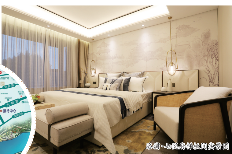
洛浦·七悦府样板间实景图

浦公园,可谓“左手繁华,右手宁静”。洛浦·七悦府属于小而精致的社区,为更好地服务洛阳青年,洛阳大地房地产开发有限公司不断深耕自身产品和服务,管理更加贴心,业主的私密性更强,在始终坚持产品立身、品质优先的同时,在楼体配色、户型设计、硬件配套、园林环境的设计上,都花费了不少心思。