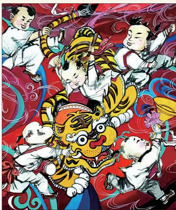
虎娃闹春 袁剑秋 画

这是说，尧作《大章》的同时，还创作了古琴曲《神人舞》。此曲表达了尧在岁首祭祀之时弹琴，奇妙琴声感动上天，天神降临，与人们欢乐歌舞，共庆盛世。