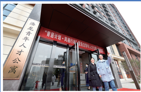
让青年人才增强归属感和幸福感