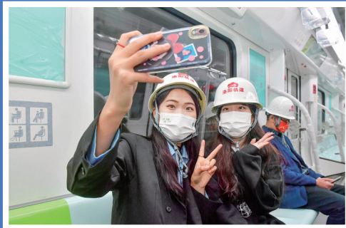
我市青年代表试乘地铁2号线