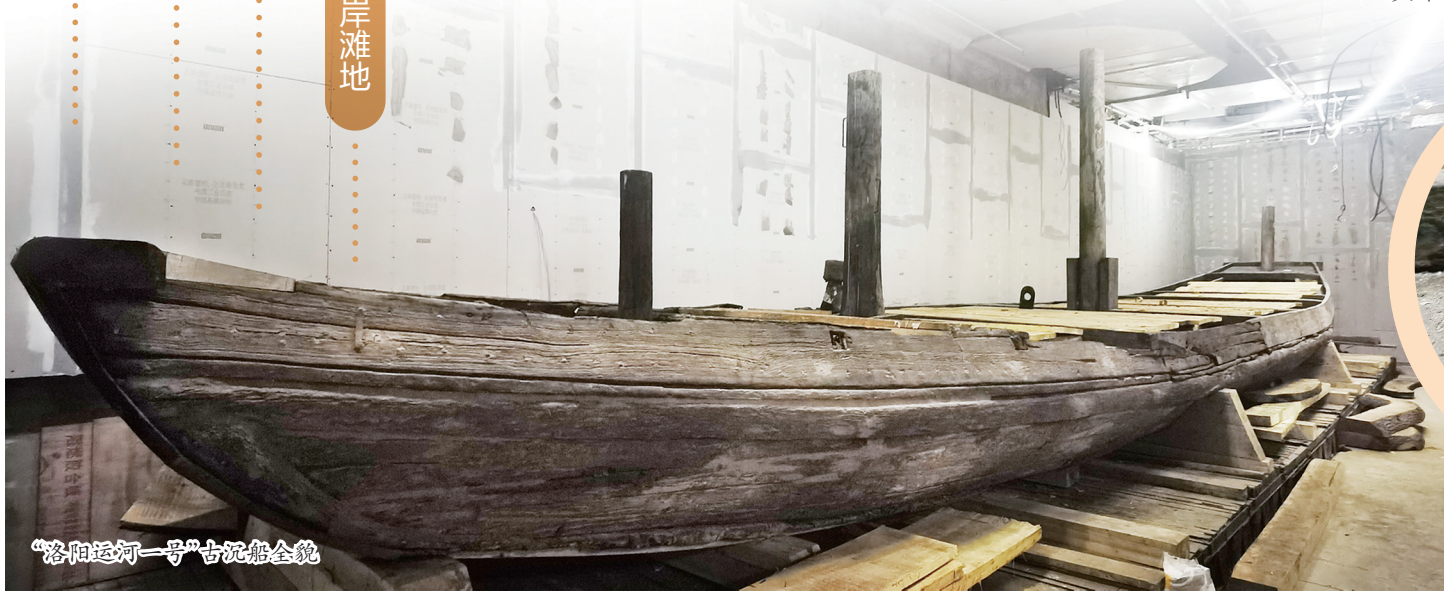
“洛阳运河一号”古沉船全貌

穿上了三彩陶瓷“外衣”,安装了超大玻璃幕墙、三彩陶瓷吊顶……隋唐大运河文化博物馆建设接近尾声