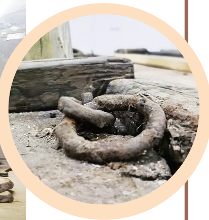
船体上残存的系统铁环