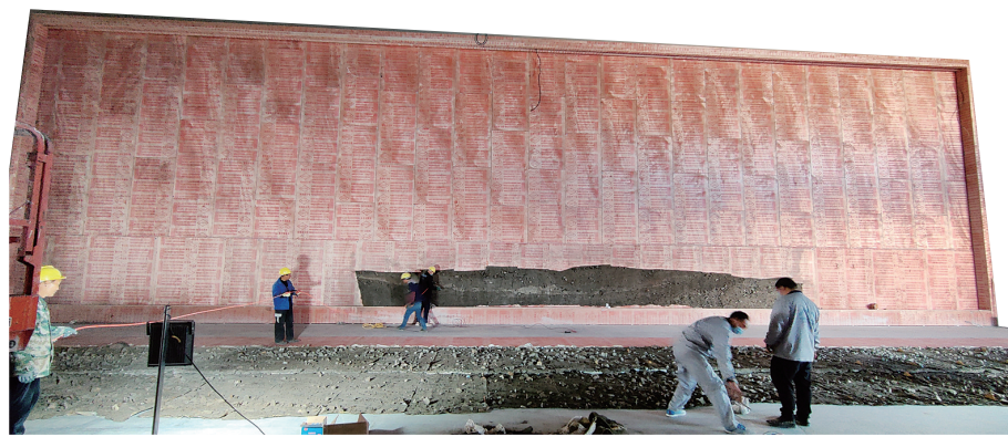
完工后,河道剖面将占满这面展示墙

昨日记者获悉,隋唐大运河文化博物馆迎来尺寸最大展品——长30米、高10米,总面积300平方米的古汴河河道剖面。这件巨型展品被安装在立面展示墙上,待博物馆开馆后向观众展示大运河的历史变迁。