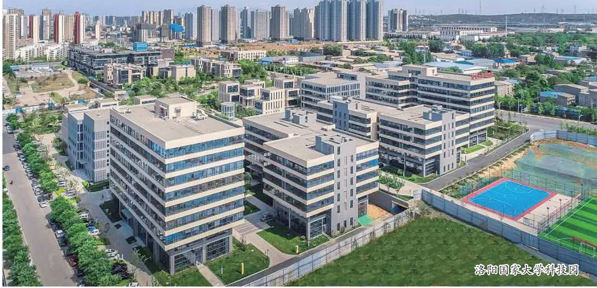
洛阳国家大学科技园