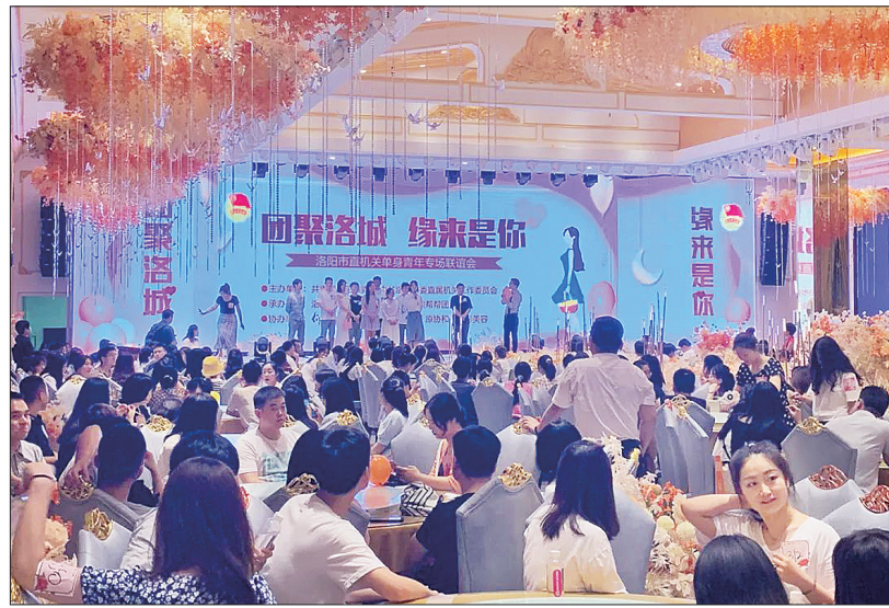
活动现场

家”及青年喜欢的文化餐饮、健身娱乐场所等,为青年婚恋交友线下活动提供实体阵地;围绕重大节日及传统节日等时间节点,在全市层面组织开展多样化的休闲娱乐等活动。 自去年以来,全市先后开展高层次人才专场、市直单位专场单身青年联谊活动,累计有550余名单身青年参加;创新举办的洛阳中秋大型古装交友游园会活动,吸引了全市200余名优秀单身青年参与;团市委参与指导的洛阳市第二届汉服集体婚礼,为30对准夫妻送上一份特殊的婚礼体验。 团市委有关负责人表示,今年将继续开展该系列活动,推动活动深入各县区,引导青年树立文明、健康、理性的婚恋观,满足广大青年婚恋交友的现实需求,切实帮助他们成家立业、扎根洛阳,为重振洛阳辉煌贡献青春力量。