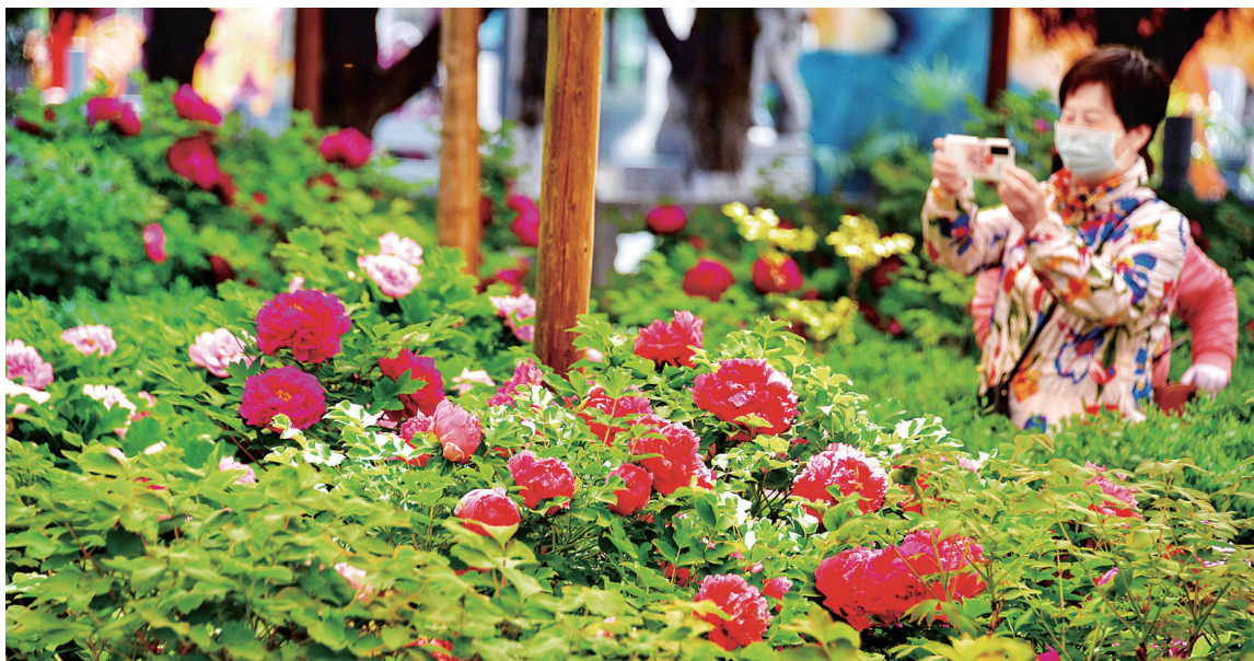
王城公园早,牡丹牡丹开放,迎来最佳观赏期