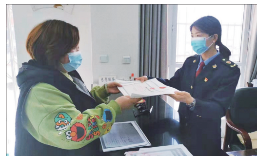
郑女士(左)在领取营业执照