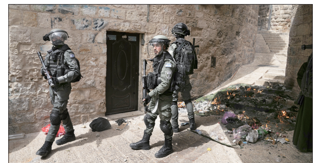
以色列边防警察在耶路撒冷老城警戒

巴勒斯坦民众与以色列警察15日在东耶路撒冷爆发新一轮冲突，超过160名巴勒斯坦人受伤。