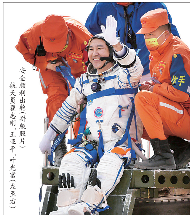
航天员翟志刚、王亚平、叶光富(左至右)安全顺利出舱(拼版照片)