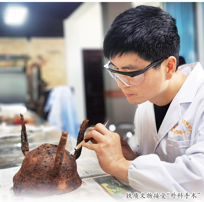
铁质文物接受“外科手术”