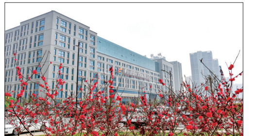
为外来客商提供一站式服务的伊川县智慧政务服务中心

用地整体打包,采取发行地方债、F+EPC模式路径,解决开发建设资金问题;对呼南高铁、沪银高铁伊川西站站前广场及商业配套2500亩建设用地、伊东新区片区6.44平方公里进行综合开发,以打造生产空间集约高效、生活空间宜居适度、生态空间山清水秀的伊东新城为战略目标,实现现代服务业集聚区发展。 全域文旅产业项目。 借助伊河国家湿地公园平台,以申报国家级水系连通及农村水系综合整治试点县为抓手,采取“智慧+”“科技+”等开发方式,对伊川深厚的文化底蕴、厚重的旅游资源,争取国家专项资金支持从万安山到黑龙山、娘娘山、九皋山、龙凤山进行全域性、整体性的规划设计与开发建设。 新能源产业开发项目。 引进全国500强、行业50强企业,开展县域适合开发条件区域的风能、太阳能等新能源产业全面开发,有效提升清洁能源开发占比。 富硒农业产业开发项目。 发挥伊川得天独厚的土地“富硒”优势,狠抓富硒小米、富硒红薯、富硒花椒三大产业,走规模化、绿色化、品牌化之路,构建多元化、多层次富硒产业发展格局,三年至五年内新增产值5亿至10亿元,努力把伊川打造成为全省闻名、全国知名的富硒农业示范区。