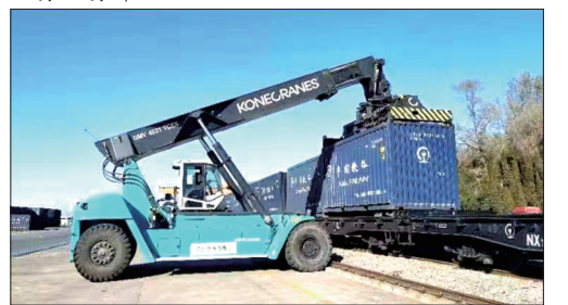
华晟物流园正在装卸货物