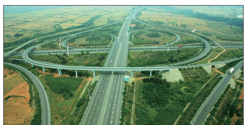
四通八达的伊川高速网