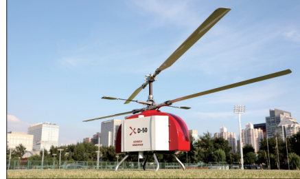
洛阳豪沃航空科技有限公司生产的工业直升机

独特的区位优势。 伊川县距洛阳仅20公里,郑少洛、洛栾、二广、宁洛、新伊高速以及焦枝铁路、三洋铁路贯通全境,区位优势独特。