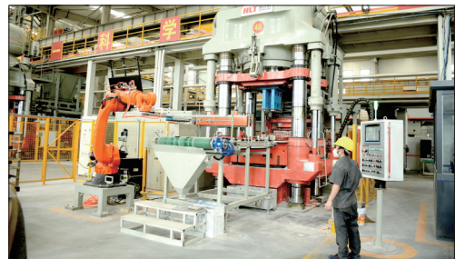
中钢洛耐(伊川)铸造车间