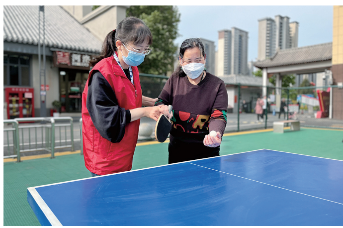
体育服务志愿者对居民进行运动指导

平整的塑胶场地、齐全的运动设施、细致的运动咨询、贴心的运动指导……记者在采访中了解到,在关林街道的多个社区体育公园里,