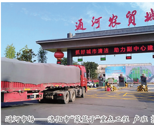
通河市场——洛阳市“菜篮子”重点工程

通河农贸市场(通河市场)自开业以来,经济效益和社会效益逐年得到大幅提升,8年来先后荣获“全国农产品批发市场行业五十强(百强)市场”“全国农产品流通骨干市场”和“农产品批发市场行业乡村振兴优秀单位”等称号,5次荣获“河南省文明诚信市场”“河南省平安市场”称号,2次荣获“洛阳市文明诚信经营示范市场”“洛阳市守合同重信用示范企业”称号。刘长河本人被省委统战部 and 市委、市政府授予“抗疫民营经济先进个人”“洛阳市抗击新冠肺炎疫情先进个人”称号,被市工业和信息化局等部门授予“洛阳市第一届优秀企业家”称号,被市人大常委会表彰为“优秀人大代表”,2次荣获瀍河区“书记、区长特别奖”。