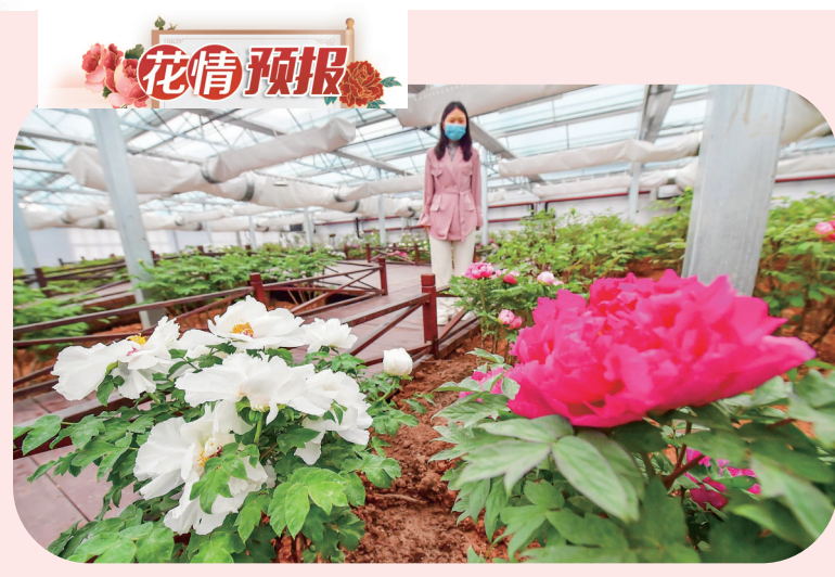
4月29日,在中国国花园锦绣馆内,盛开的牡丹惹人醉