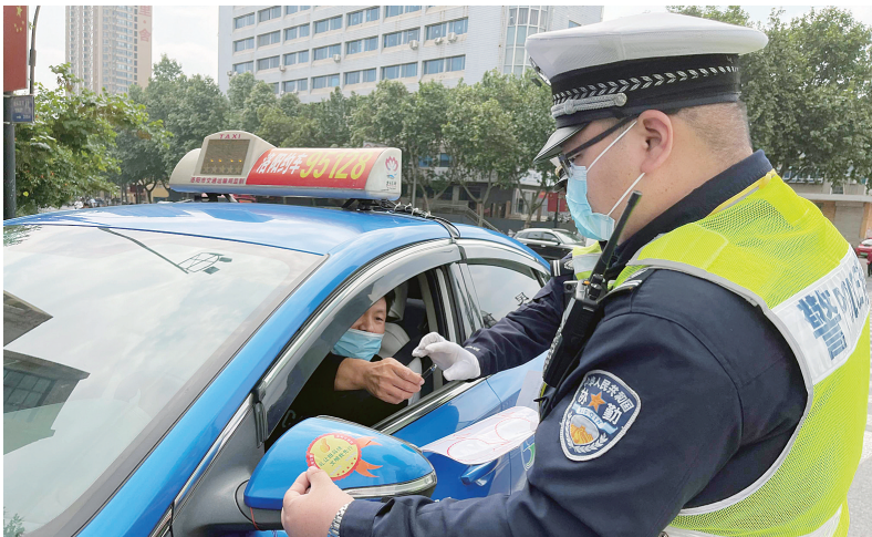
交警为车辆贴上“小红花”车贴

今年以来，定期发布礼让斑马线“红黑榜”，已成为我市“礼让斑马线，交通助文明”新时代文明实践活动的常态化内容。目前，由市委宣传部指导，市创建办、市文明办、市交警支队和洛阳日报社联合发起的