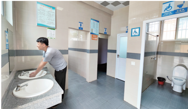
白湾社区的水冲厕所

阔的水泥路、美观大方的光伏路灯、丰富多彩的文化墙、赏心悦目的花草树木一一映入眼帘,居民是看在眼里、喜在心上。