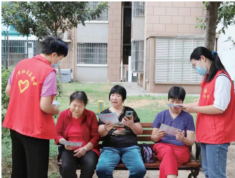
社区志愿者在服务居民

越来越多的人加入志愿服务事业,一条条溪流汇聚成充满爱心的大海。截至目前,我市拥有志愿服务组织2485个、各类志愿服务队伍3096支、实名注册志愿者118万名,志愿服务项目达2356个。