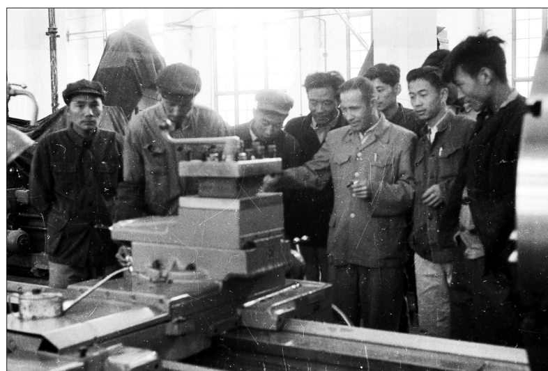
焦裕禄（左四）与苏联专家雅辛斯基在检查机床设备