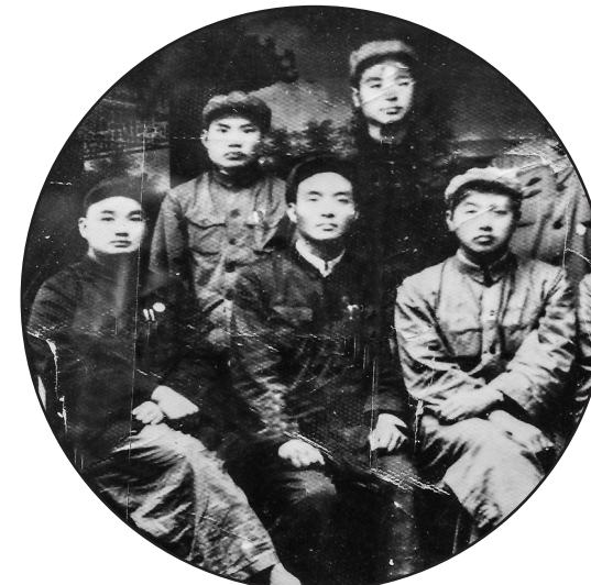
到洛矿工作前夕，焦裕禄（前中）与同志合影留念