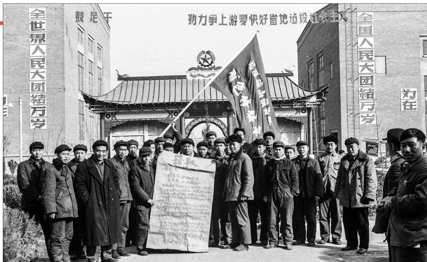
在洛矿担任一金工车间主任期间，焦裕禄（前排左二）带领团队屡创生产佳绩