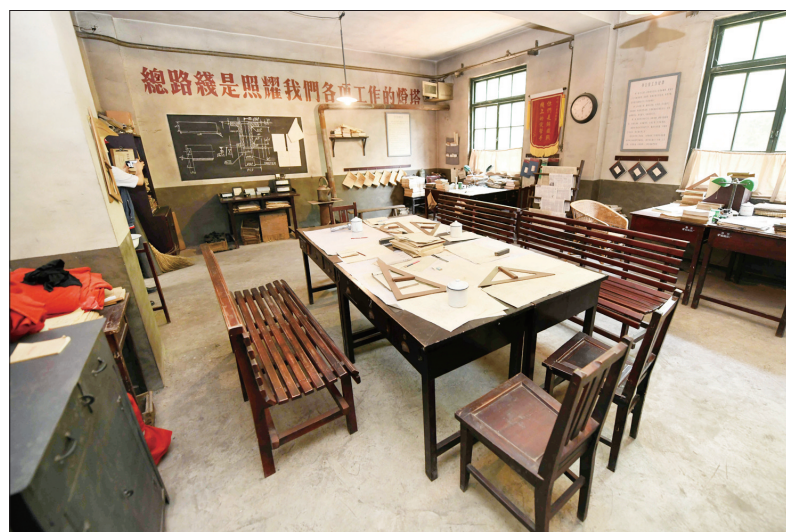
焦裕禄同志曾经工作过的办公室