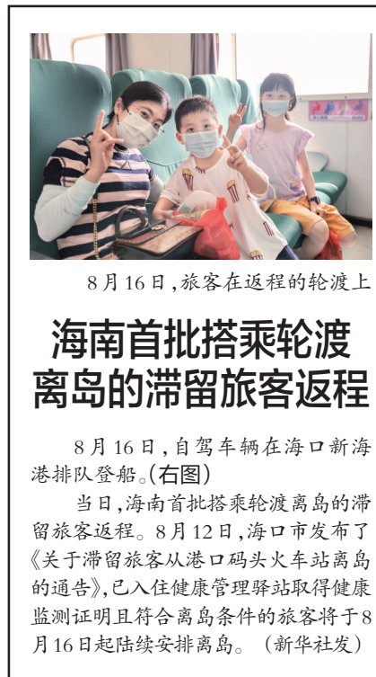
8月16日,旅客在返程的轮渡上

据韩国《朝鲜日报》16日报道,韩国全国民主劳动组合总联盟下属组织“统一先锋队”日前在韩国各地驻韩美军基地接连举行集会,要求驻韩美军撤离韩国。(新华社/纽西斯通讯社)