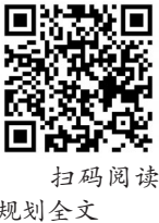
扫码阅读 规划全文

繁荣,公共文化服务体系、文化产业体系、全媒体传播体系和文化遗产保护传承利用体系更加健全,文化创新创造活力显著提升,文化和旅游深度融合,城乡区域文化发展更加均衡协调,人民精神文化生活日益丰富。中华文化影响力进一步提升,中外文化交流和文明对话更加深入,中国形象更加可信、可爱、可敬,推动构建人类命运共同体的人文基础更加坚实。中国特色社会主义文化制度更加完善,文化法律法规体系和政策体系更加健全,文化治理效能进一步提升。