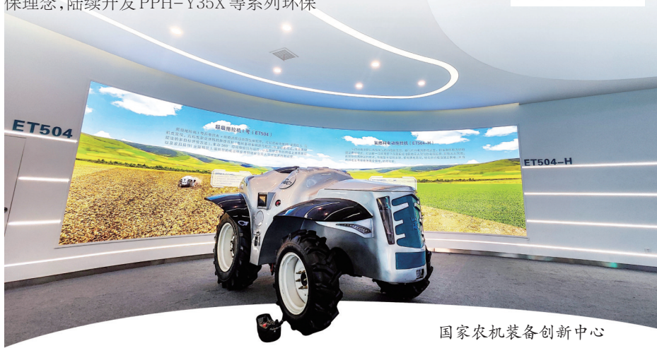
国家农机装备创新中心

(上接01版)要加大组团连片改造力度,出台棚户区连片改造支持政策,加强市级层面面对古城片区改造整体统筹力度。