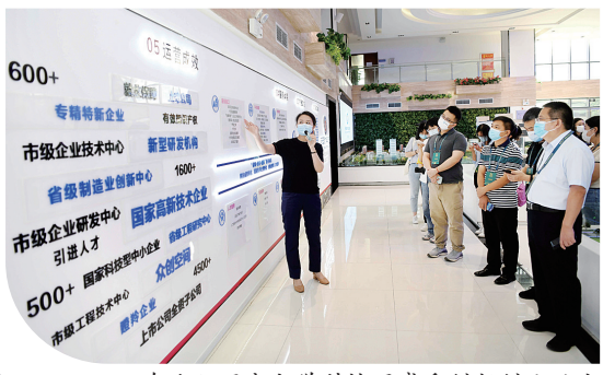
在洛阳国家大学科技园感受创新创业活力