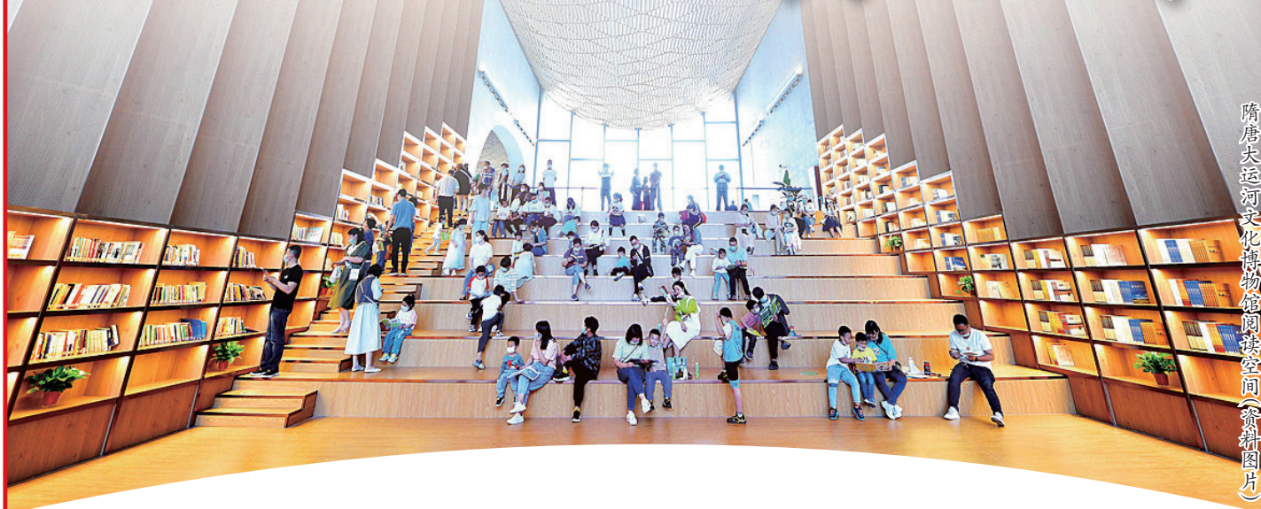
隋唐大运河文化博物馆阅读空间(资料图片)

临黄河而知中国,临河洛而知华夏。洛阳是黄河文明的一颗璀璨明珠,河洛文化是黄河文化的源头和重要组成部分。