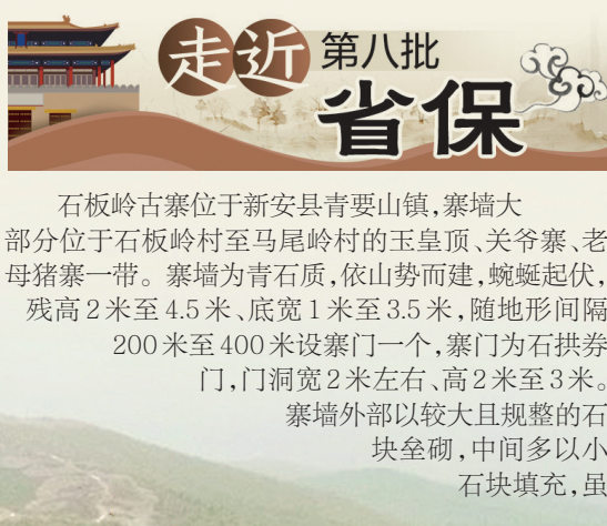
蜿蜒起伏,依山而建