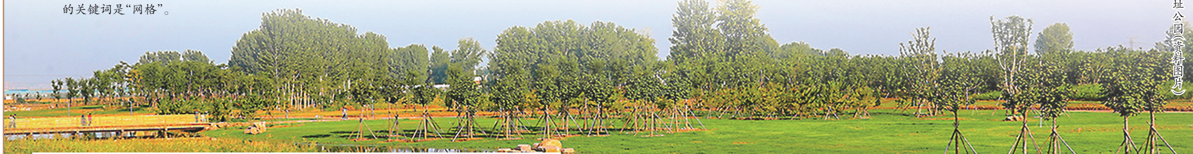
二里头考古遗址公园(资料图片)

没有案例供参考,没有资料可查阅,没有专家来指导,如果您穿越回3800年前,担任东亚地区第一个广域王权国家的都城建设总设计师,您会按照怎样的理念去规划?如果您一时没有眉目,不妨看看二里头都邑给出的答案,其中的关键词是“网格”。