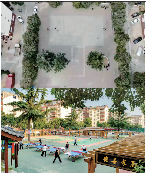
社区体育公园提升改造前后