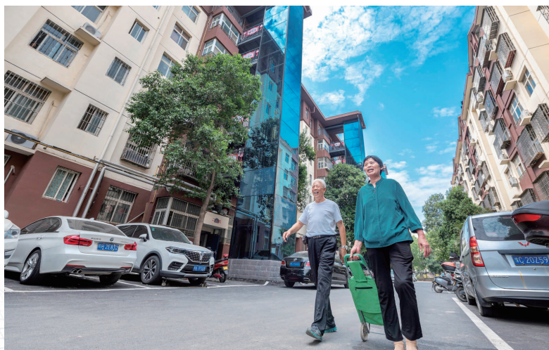
加装电梯 出行便利