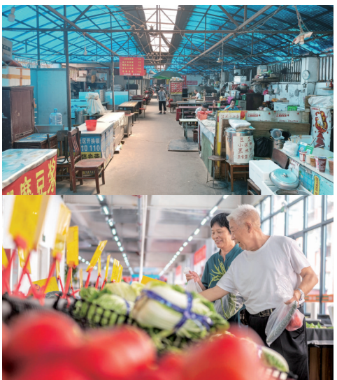
菜市场“升级”为超市