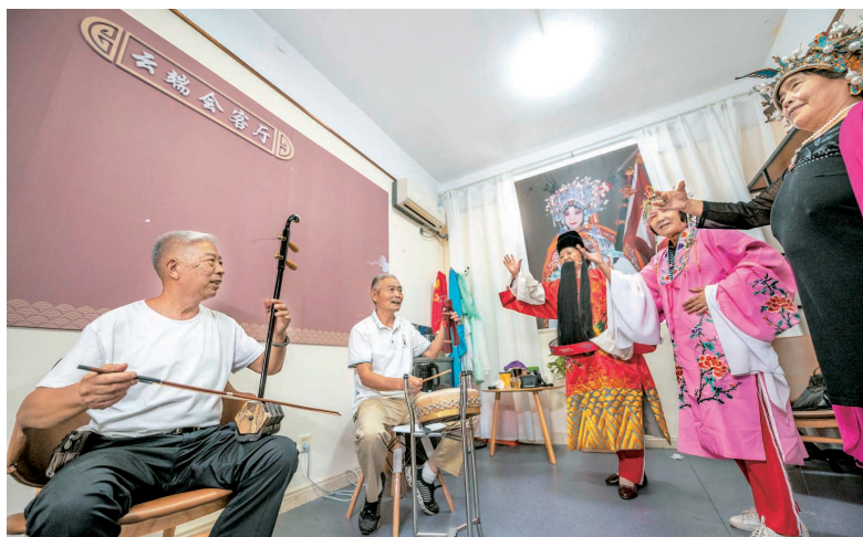
娱乐消遣 文化养老