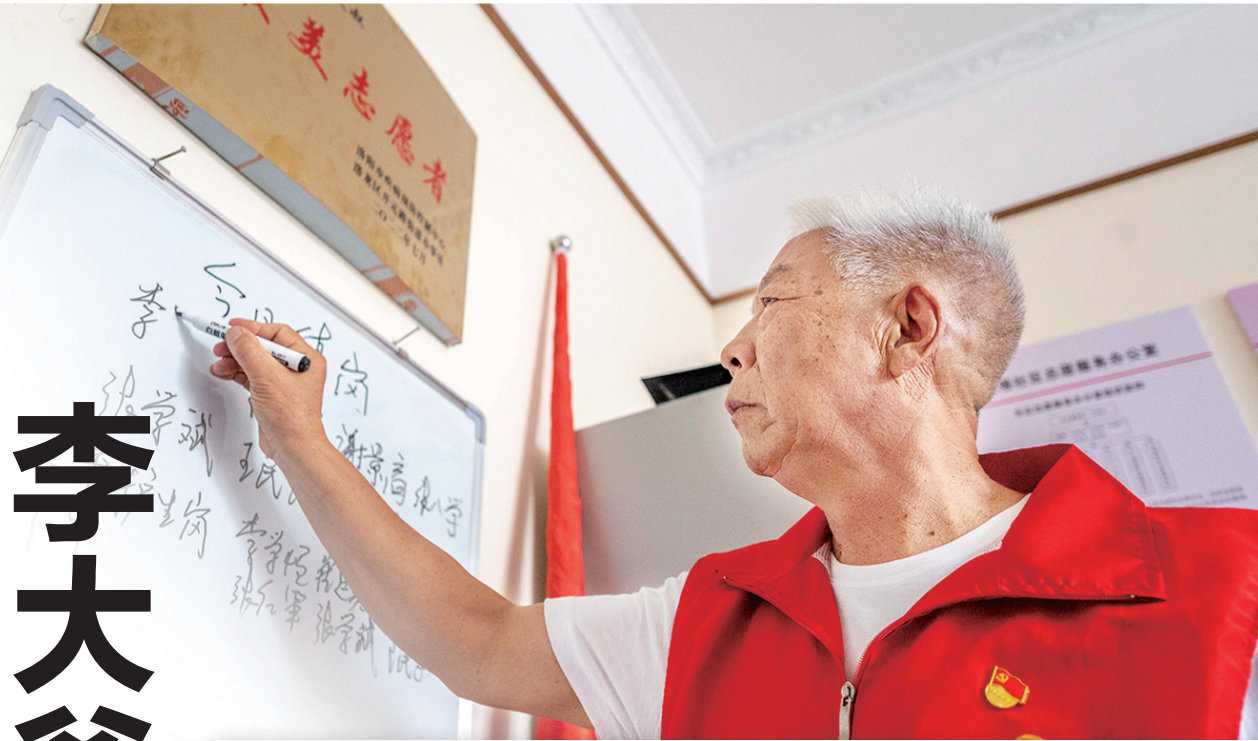
安排值班 社区自治