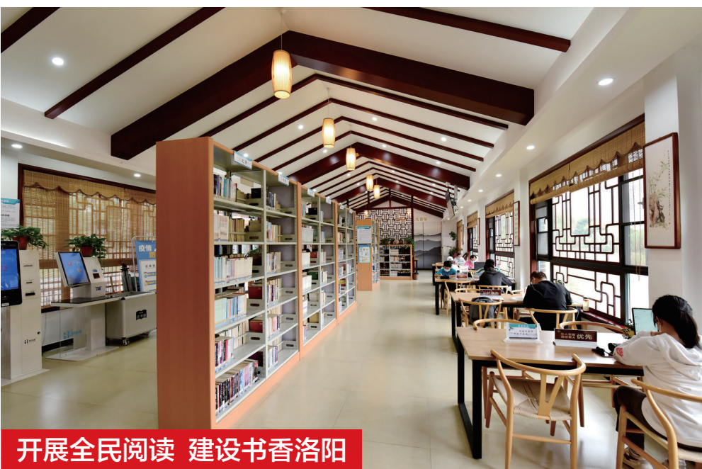
开展全民阅读 建设书香洛阳

书香河南首届全民阅读大会洛阳市孟津区分会场开幕式9月23日在该区新时代文明实践中心举行。自24日开始,该区各大城市书房、农家书屋全天候开放,为城乡居民提供了书香盛宴。以“书香润万家·奋进新时代”为主题的全民阅读活动,让阅读成为城镇居民的生活乐趣,让阅读成为群众致富的“充电站”,打通了公共文化服务“最后一公里”。