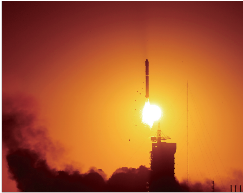
10月9日7时43分,我国在酒泉卫星发射中心使用长征二号丁运载火箭,成功将先进天基太阳天文台卫星发射升空

载的全日面矢量磁像仪每18分钟就可以对全日面磁场进行一次高精度成像,有助于完整、准确地记录下太阳磁场的变化,进而侦察、破解太阳能量释放的一系列奥秘。”全日面矢量磁像仪载荷