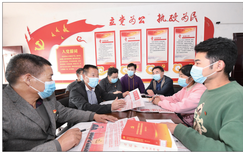
新安县南李村镇谢村党员干部学习党的二十大精神

孟津区西霞院街道郭庄社区依靠草莓、葡萄、吊瓜等特色瓜果种植,让群众的日子越过越红火。连日来,郭庄社区的党员干部持续学习党的二十大精神,更加坚定了推进乡村全面振兴的信心和决心。