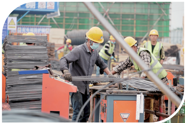
图均为项目建设现场