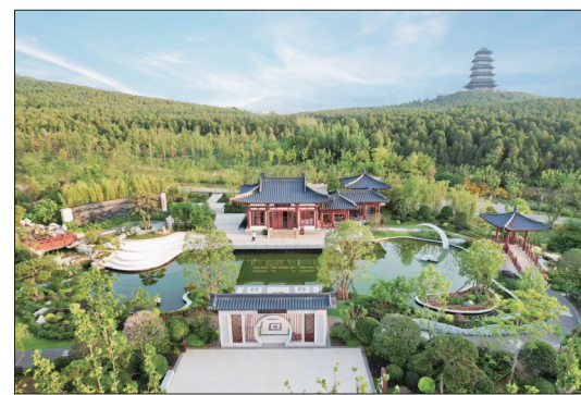
洛园区全景

昨日,记者从市城市管理局获悉,在日前举办的第十三届中国(徐州)国际园林博览会上,我市的参展作品“河南园·洛阳”凭借精美的园林艺术和厚重的河洛文化,获得7个奖项。