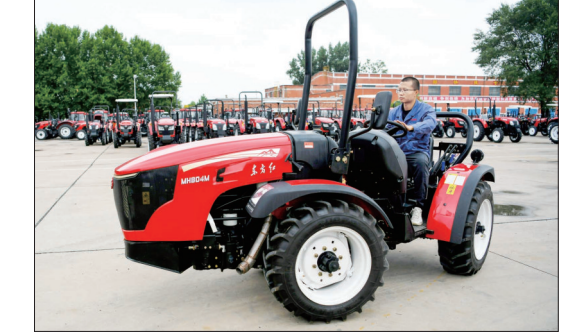
东方红MH804丘陵山地拖拉机(资料图片)

本报讯(洛报融媒记者 陈曦 通讯员 陶建华)记者从中国一拖获悉,由该企业研制的国内首款丘陵山地专业型拖拉机东方红MH804系列产品,近日被《2022年中国农业年鉴》《2022年中国农业机械年鉴》双双收录,标志着全国农机行业对该项“洛阳创新”的高度认可。 作为业内颇具权威性的年鉴,《2022年中国农业年鉴》《2022年中国农业机械年鉴》分别以《填补了国内丘陵山地专业型拖拉机产品空白》《中国一拖实现国内丘陵山地专业型拖拉机产品国产化替代》为题,对MH804系列产品作出高度评价。