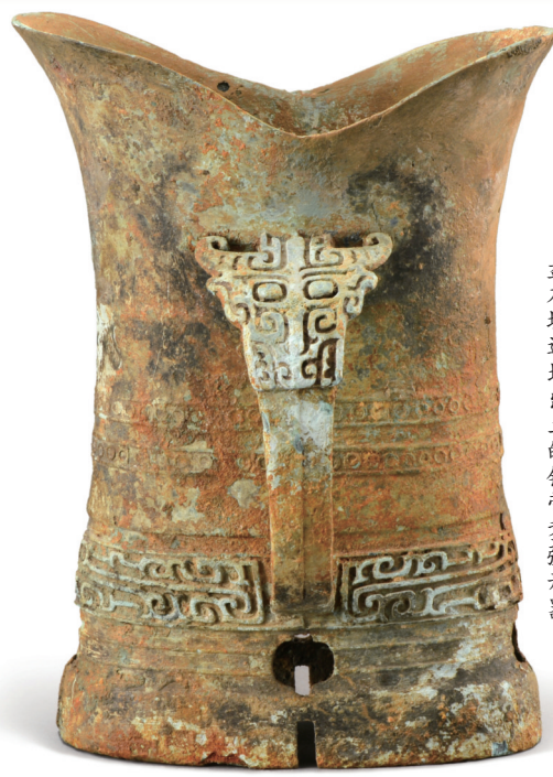
盘龙城遗址出土的铜带菱形器