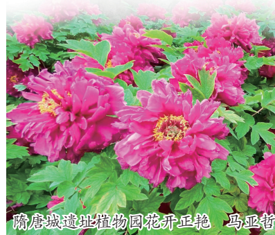
隋唐城遗址植物园牡丹花展

全国共有约670个品种牡丹开放,开花牡丹约占该园牡丹的60%,主要分布在九色园、百花园、特色园、科技园。盛开的牡丹品种有浪花锦、太阳、日月交辉、和政玛瑙盘等,初开的牡丹品种