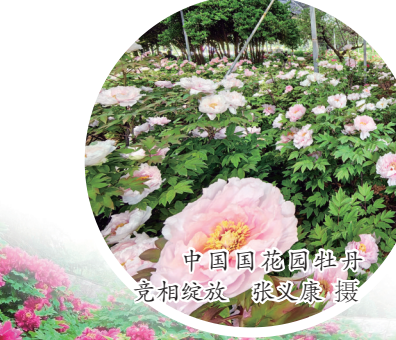
中国花园牡丹 竞相绽放

布在南园牡丹展览馆、凤丹林、基因库、国际牡丹品种区、精品园、北园广场西、北园广场东、江南品种区、西南品种区。盛开的牡丹品种有赛墨莲、青龙卧墨池、墨玉存金、黑夫人、寿星红、太阳、芳纪、岛锦、百园红霞、冠世墨玉、金玉良缘、太平红、洛阳春、酒醉杨妃等,初开的牡丹品种有紫红霞、软枝蓝、五洲红、红旭、大藤锦、肉芙蓉、银红巧对、香玉、白玉等。园内荷包牡丹、紫藤、棣棠、樱花等繁花似锦。