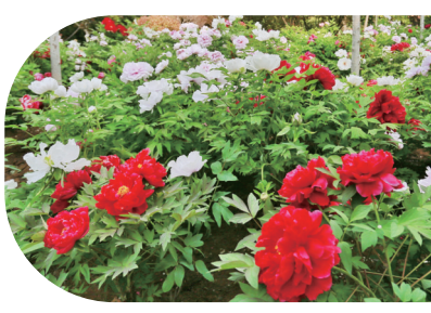
王城公园牡丹锦簇

全国共有约18个品种牡丹开放,开花牡丹约占该园牡丹的52%,主要分布在古牡丹园、瀛园。盛开的牡丹品