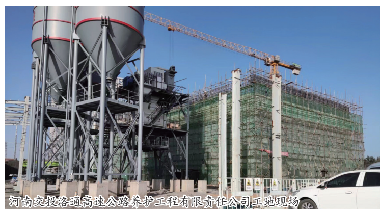
河南交投高速公路养护工程有限责任公司工地现场

走进位于孟津区平乐镇张盘村的洛阳高速公路养护综合基地,项目建设工地一片繁忙景象,工人们正在这充满希望的季节铆足干劲,加紧施工,全力推进项目建设。今年以来,平乐镇认真贯彻落实市委、区委决策部署,坚持“项目为王”理念,聚焦孟津区“345”发展战略,深入开展“万人助万企”活动,持续优化营商环境,推进项目建设,为镇域经济高质量发展蓄势赋能、护航助力。