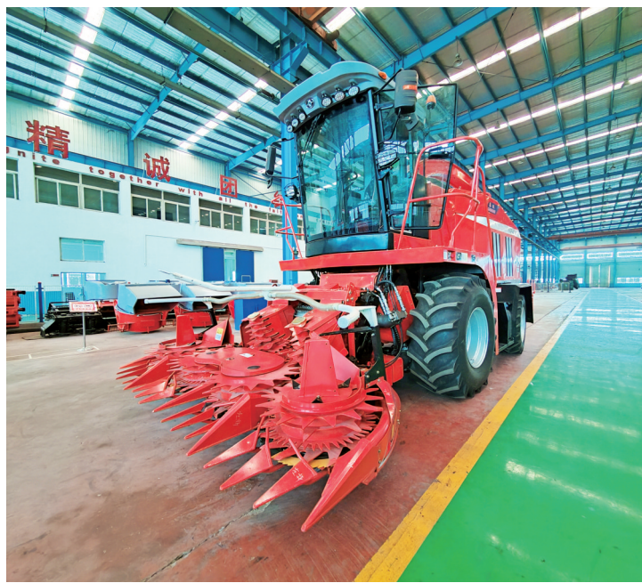
4GZ-18型青饲料收获机生产现场