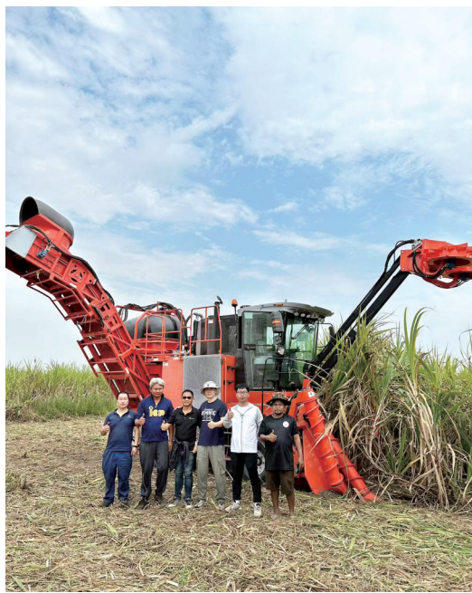
4GQ-1C型甘蔗收获机受到泰国客户好评

针对许多国外品牌地表以下甘蔗无法收割的“痛点”,这款甘蔗收获机可以入土收割,将甘蔗“吃干榨净”;通过动力的配置优化等,260马力的这款甘蔗收获机,可以达到国外大牌330马力同类型农机收获效率,降低1/4的能耗……拥有高性价比的这款产品,一经上市就受到泰国等国家