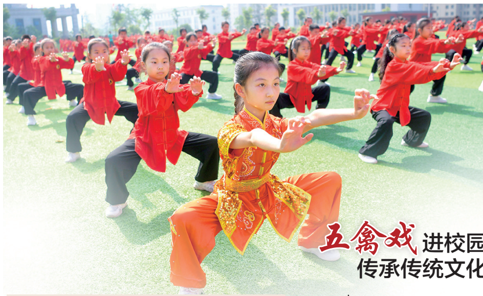
五禽戏进校园 传承传统文化