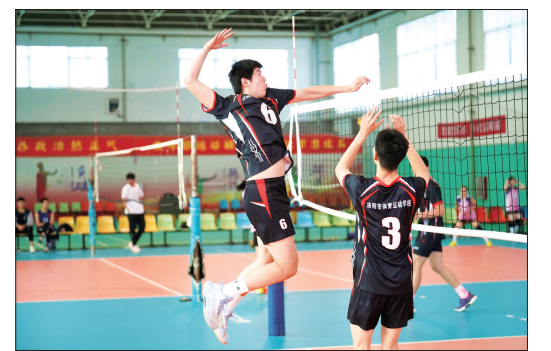
排球队员训练备战

“在刚刚结束的河南省中国式摔跤冠军赛暨省第十四届运动会资格赛上,我校代表队获得3金、4银、6铜和8个第五名的好成绩,团体总分排名第一,共有10人获得省运会决赛资格……”昨日上午举行的省十四运会倒计时80天洛阳文化旅游职业学院誓师动员大会上,传来不少好消息。