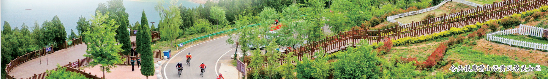
谷头镇凤凰山沿黄风景美如画

发展特色种植数字辣椒5万亩、优质红薯5万亩、高粱2万亩、鲜食玉米2万亩、冬桃1万亩。