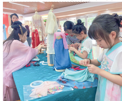
家长与小朋友沉浸式体验汉服娃娃衣亲子活动