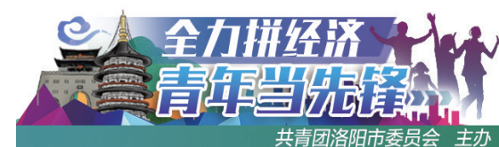
共青团洛阳市委 主办