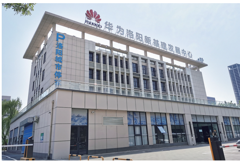
洛阳昇腾人工智能实验室一期

首先是算力高效。实验室AI推理资源可提供最高3倍的场景推理性能,缩短一半左右的推理应用开发周期,