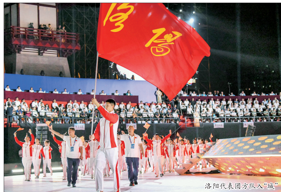
洛阳代表团方队入“城”

激情点燃梦想,拼搏铸就辉煌。让我们相逢神都,尽享体育盛会的快乐、体验古都洛阳的风采。(本版图片均由洛报融媒记者摄)