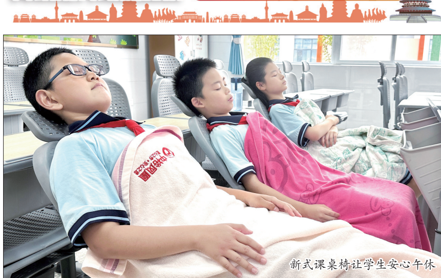
新式课桌椅让学生安心午休