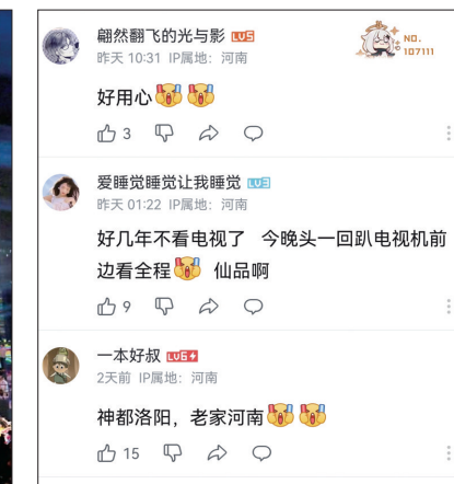
网友在哔哩哔哩直播评论区点赞(网络截图)