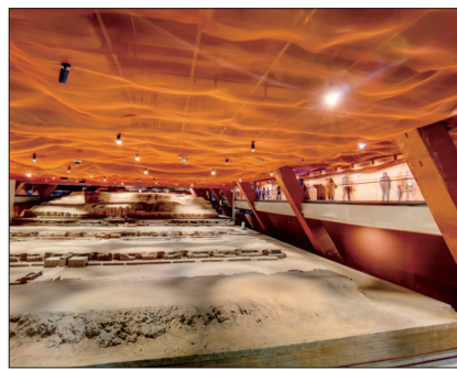
▲游客在应天门遗址博物馆参观