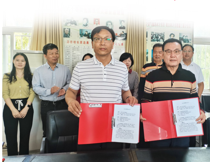
签署定向捐赠协议

本报讯(洛报融媒记者 蒋颖颖 通讯员 麦怡琳)昨日上午,在宜阳县赵保镇东赵村,赵保镇屏阳中学附属小学(屏阳附小)新宿舍楼奠基。当日,深圳市宝安区慈善会捐赠300万元,用于屏阳附小新宿舍楼建设。