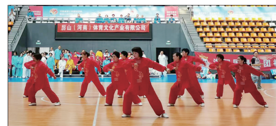
洛南无拳研究会组织喜迎中秋、国庆南无拳表演