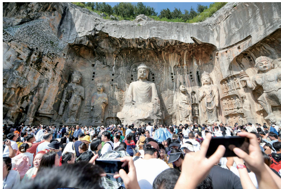
▲龙门石窟景区游人如织

此外,我市聚焦“新文旅 新体验 新消费”,举办了第六届中原国际文化旅游产业博览会——汉服时尚设计周、穿越唐朝研学活动、东方博物馆之都系列活动、“河洛金秋韵 醉美乡村游”县区联动活动,一些主要旅游景区也开展沉浸式演出、全城NPC互动活动等,活动丰富多彩,聚合效应明显。