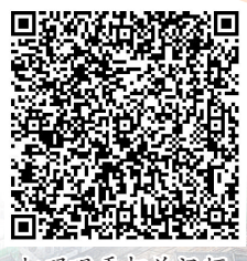
扫码观看相关视频