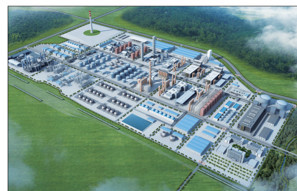
洛阳石化百万吨乙烯项目效果图 (资料图片)

本报讯(洛报融媒记者 张锐鑫 通讯员 李亚伟)10日上午，市绿色石化及先进材料产业研究院在中国石油化工有限公司洛阳分公司(简称洛阳石化)挂牌成立，未来将围绕百万吨乙烯项目及上下游、左右链企业的发展需求开展“产学研销用”定制化开发。