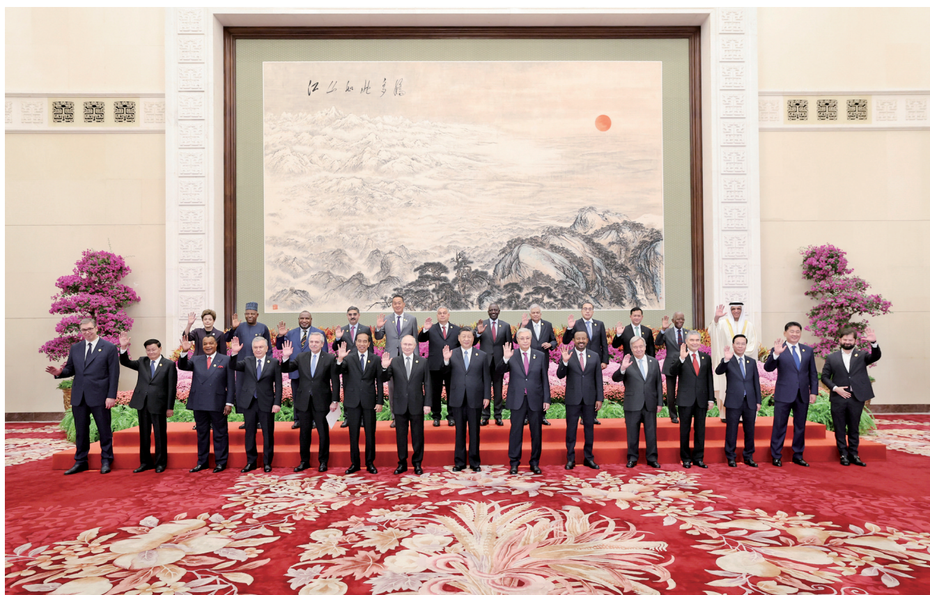
10月18日上午,国家主席习近平在北京人民大会堂出席第三届“一带一路”国际合作高峰论坛开幕式并发表题为《建设开放包容、互联互通、共同发展的世界》的主旨演讲。这是会前,习近平同出席高峰论坛的外国国家元首、政府首脑和国际组织负责人等国际贵宾集体合影。