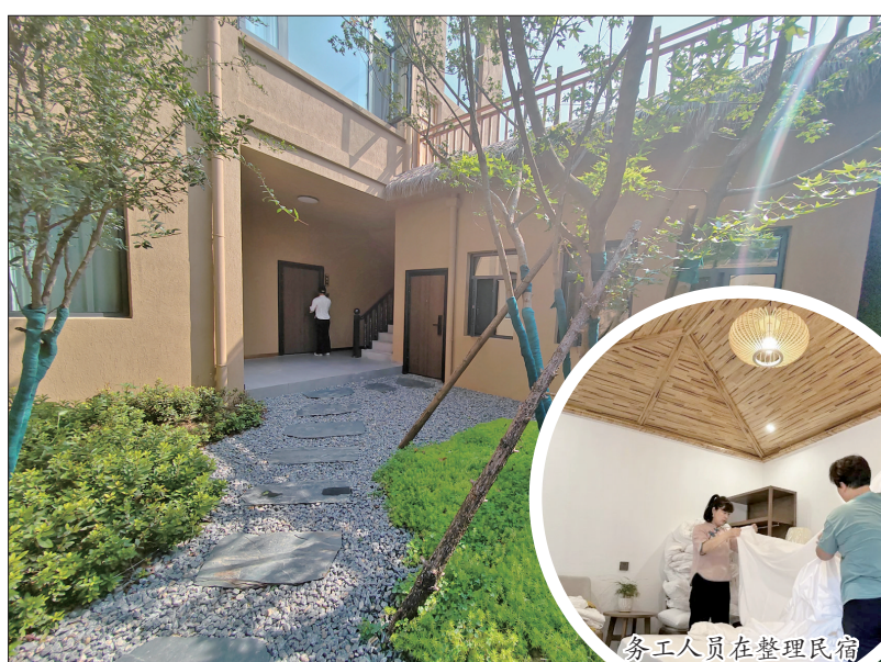
淡雅恬静的民宿小院

两三千元的月薪,不只意味着有了份稳稳的收入,也让她终于可以一边在家门口打工,一边照顾小儿子,“以前是