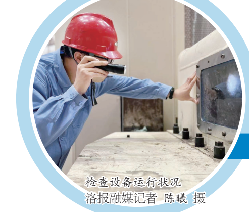
检查设备运行状况

近日,伊滨区游客集散中心建成投用,将为游客提供更好地旅游体验。 该游客集散中心位于伊水游园求是段,设置服务台、导游室、休息区、文创商店、茶水间、卫生间等,可满足游客不同需求,也将进一步增强区域集散功能,丰富区域业态和文化内涵,提升区域旅游品质。