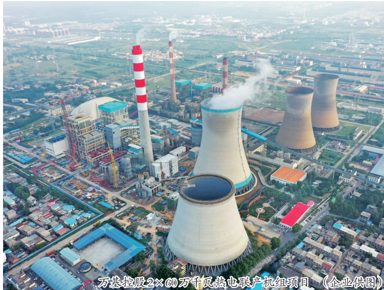
万基控股2×60万千瓦热电联产机组项目

在1号机组168小时试运行期间,项目建设指挥部严控安全生产,积极配合参建各方,全力保障机组安全、高效、准点投产。后续指挥部将继续保障1号机组安全、经济、高效、长周期稳定商业运行,同时扎实推进2号机组生产建设,力争早日实现双机组全面投产。