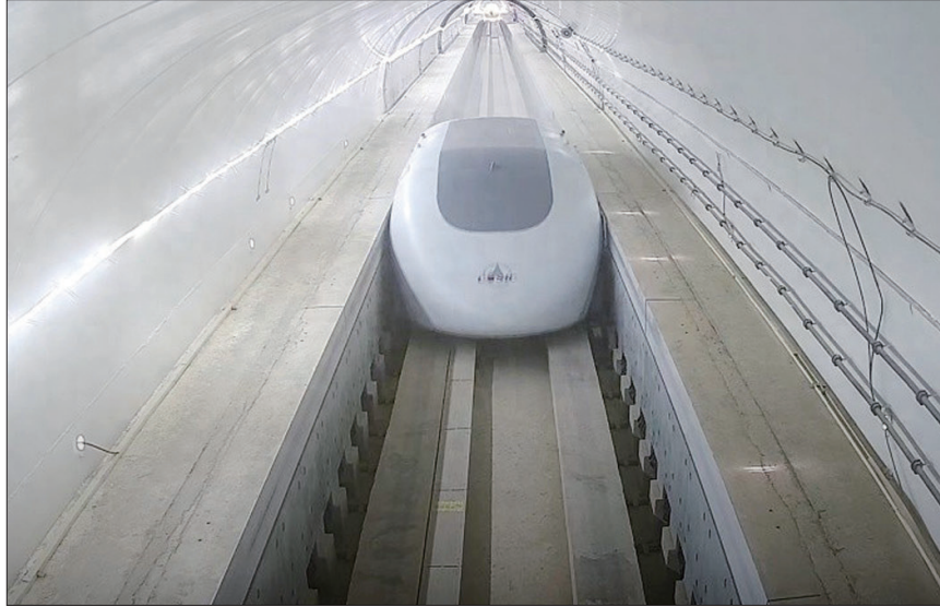
试验线内部场景(资料图片)

在具体应用中,波纹管伸缩装置连接两段管道,利用自身的变形功能,补偿管道因压力、温度变化等引起的应力