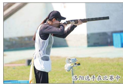
洛阳选手在比赛中

23日、24日,2023年河南省青少年射击锦标赛(飞碟项目)在宜阳凤凰岭射击射箭训练基地举行。