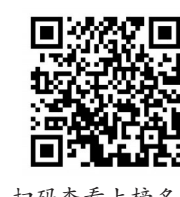
扫码查看上榜名单

下一步，我市将利用多种渠道深入宣传先进人物典型事迹，号召广大党员干部群众向榜样看齐，用实际行动积极培育和践行社会主义核心价值观。